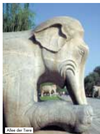
Allee der Tiere

Mahlzeiten und Getränke zu den Mahlzeiten, soweit nicht erwähnt, Trinkgelder, Ausgaben des persönlichen Bedarfs, persönliche Reiseversicherungen, Ausflugs-paket, sonstige, nicht genannte Leistungen